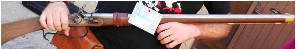
Figura. 2. Réplica de mosquete de pedernal.

1,5m respecto al suelo, en el centro del recinto. En el momento de la medida sólo el operador del sonómetro estaba presente en la dependencia donde se realiza la medida. El tirador se situó a una distancia de 4 metros de la fachada del edificio, a nivel de la calle.