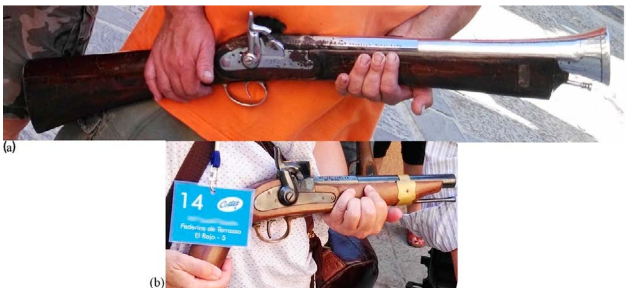
Figura 5. (a) Trabuco Mod. Abuelo. Cal. 90. 111cm, 9,4kg. Carga 20 gr pólvora. (b) Pistola de pistón Mod. 5. Cal. 31. 44cm, 1,4kg. Carga 6 gr pólvora.

Al analizar el comportamiento de las distintas armas, si bien se detectan diferencias estadísticamente significativas en las mediciones, estas no son muy acusadas cuando se valoran clínicamente, con valores comparables a los comentados en el estudio de las distintas frecuencias. Las medias de sonido producidas por las distintas armas de avancarga estudiadas se encuentran por encima de los 100 dB, sin grandes diferencias clínicas entre armas teóricamente muy distintas. Así, en medidas a un metro del tirador, para un trabuco del modelo Abuelo, del calibre 60, usando 20 gr de carga de pólvora, se consigue una media de 116,95dB, mientras