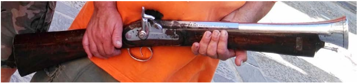
Figura. 1. Trabuco Modelo 'Abuelo' Cal. 90. 111cm, 9,4 kg. carga 20 gr de pólvora.